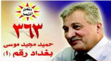
للمستقبل .. التغيير يبدأ