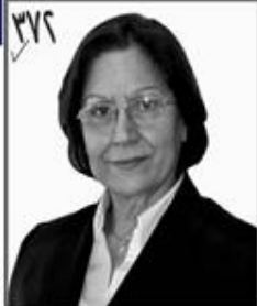
٦ / په فشان زهنگه بازنهکی له لێژاردنی سلێمانی